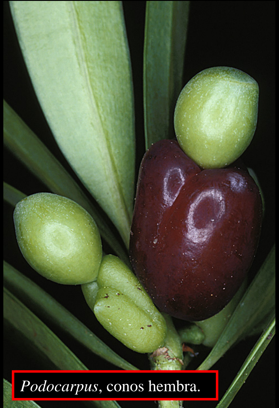
Podocarpus , conos hembra.