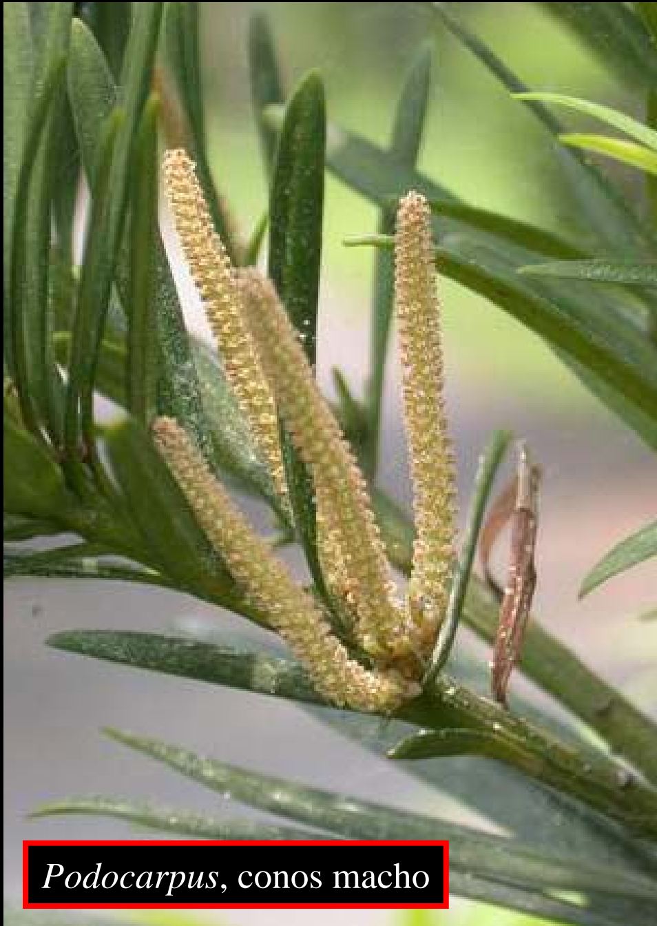
Podocarpus , conos macho