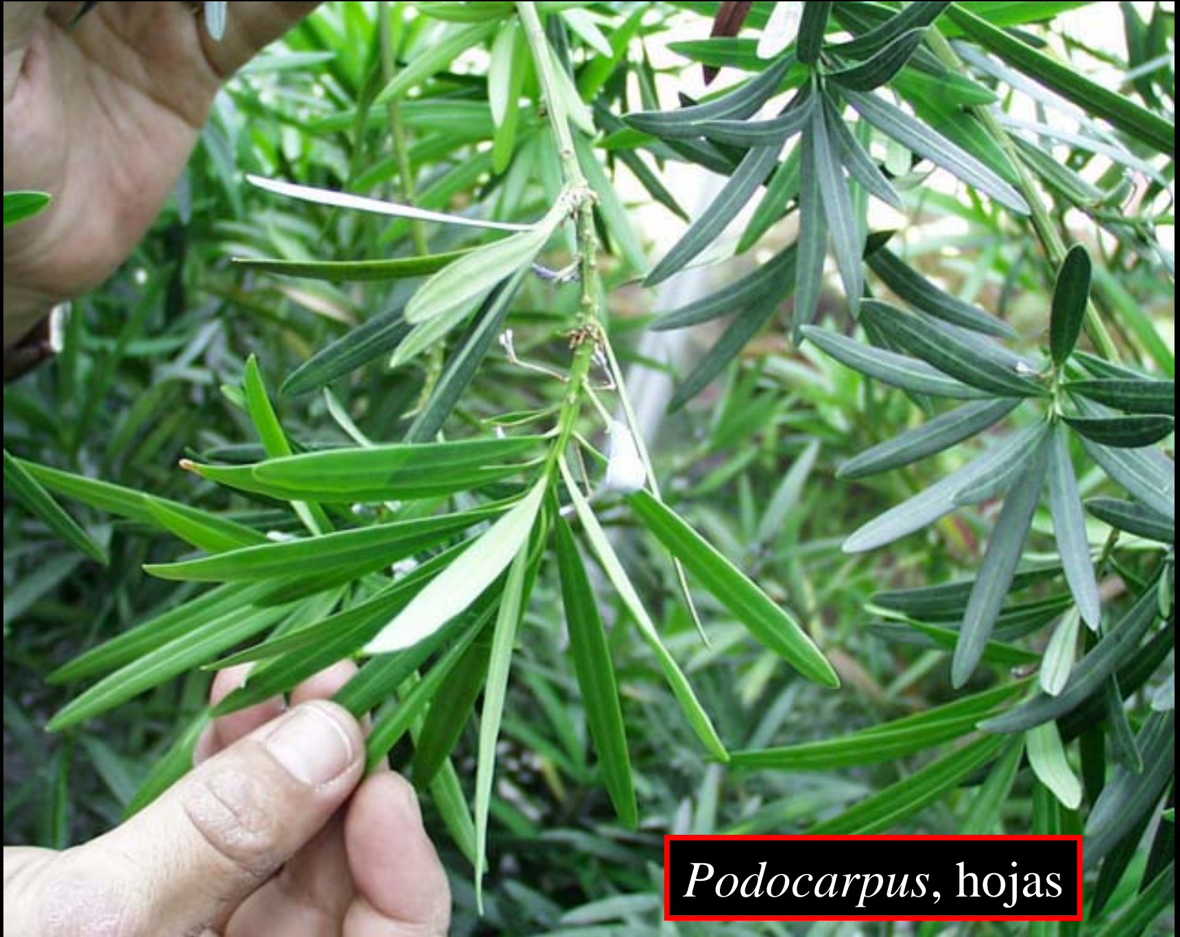
Podocarpus , hojas